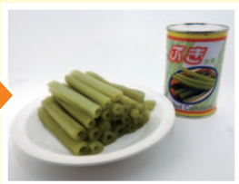
オリジナルのフキ缶詰