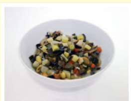
フキの入ったけのしる