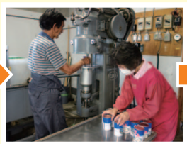
缶詰加工を依頼する