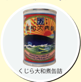
くじら大和煮缶詰