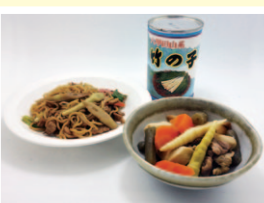
ネマガリタケの焼きそばと煮しめ