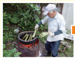
採ってきたフキを煮る