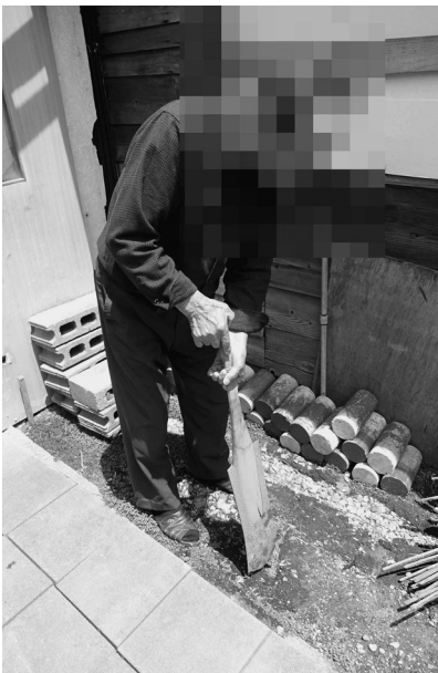
テンテキの使い方（E氏）

採取の時期・場所・主体 ▼サルケを切るのはE氏の父親であつた。——「ムガシな。いや実際オラも子どもだづぎチヂオヤ サルケ切つてな。」