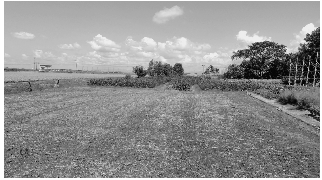
サラケ採掘跡(畑地)左の田よりも一段低くなっている

用途 ▼シボドでサラケを焚いた。昭和20年以降、正確な時期は忘れたが、時代が下るとストーブの燃料としてもサラケを用いた。——「もつろんシボドでねあまいね。うん。してそれがら、たげ、こうストーブあつてきてストーブさも、やあくべだんた感じすなあ。ま、ストブなんてストブがらこだマギなたはんてな。昭和20年頃までだばサルケ焚いであつたんた気すなあ。」「ストーブ始めだのは戦後だどごで、2……んだなあ。20年以降だでばの。何年だつたべがなわがねぐなつてまた、ま、20年(よりも)後だな。20年だば終戦のどぎだべ。カマやつたどぎ。そのあだり、ストーブ…そのあだりもサルケ焚いだんた気するなあ。ストーブさサラケ焚いだりしたもなあ。」