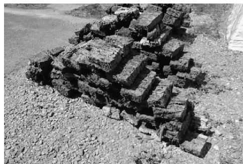
線状に重ねる（参考写真）

▼この証言が正しいとすれば、サラケの積み重ね方は、線状に並べる場合と、面状に並べる場合の、2通りがあったことになる。筆者の調べでは、秋田県横手地方でも同様の2通りの方法があった（右写真は参考）。